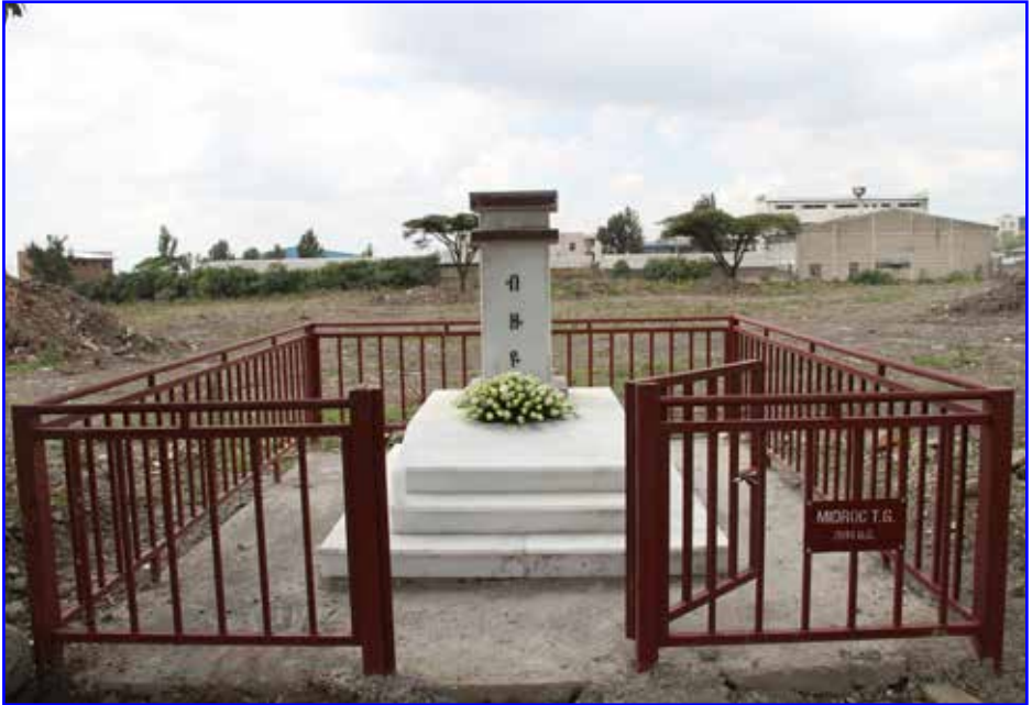
የብዙነሽ በቀለ መካነ መቃብር የቀድሞ ሀውልት