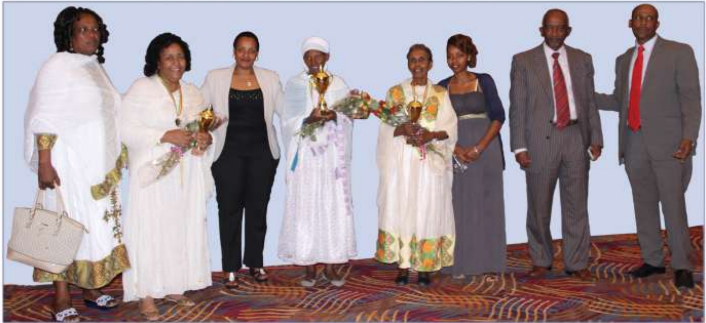
የዕለቱ የክብር እንግድነት ከተሸላሚ እናቶች ጋር

ኃላፊዎችም በክብር እንግድነት ተገኝተዋል። በቅድሚያ ስለ ፕሮግራሙ በዘጋጅቹ በኩል መግለጫ ከተሰጠና እናትን በሚመለከት የተለያዩ ጽሁፎችና መልእክቶች በንባብ ከተሰሙ በኋላ በዕለቱ በአርእያነታቸው ለመሰጠትና ለሽልሙ የሚገባቸው ኢትዮጵያውያን እናቶች የተመረጡ መሆኑ ተገልጿል። የዕለቱ የክብር እንግድነት ዘጋጅቹ ያቀረቡትን ሽልማቶች ለተመረጡት ሦስት እናቶች በየተራ እንዳ የበረከቱ ተደርጓል።