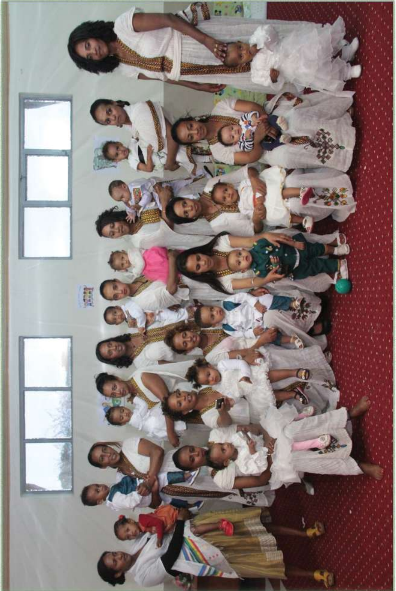
የግብርና ስልጠና ላይ ተገኝቶ የሚገኙ ስድስት ወራት ልጆች