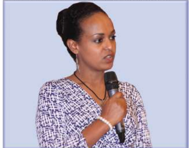
በመቻራ ኮርፖሬት ሴንተር ባለው የእናት መዋያ ተጠቃሚ ከሆኑ የከባንደዎች እናት ሠራተኞች መካከል እንደ ማቆያው ላይ ገንጠር ሲያደርጉ