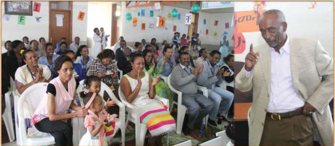
ዶ/ር ኦሪኒ ይርዳው በግብርና ሚኒስቴር ሲገልጹ