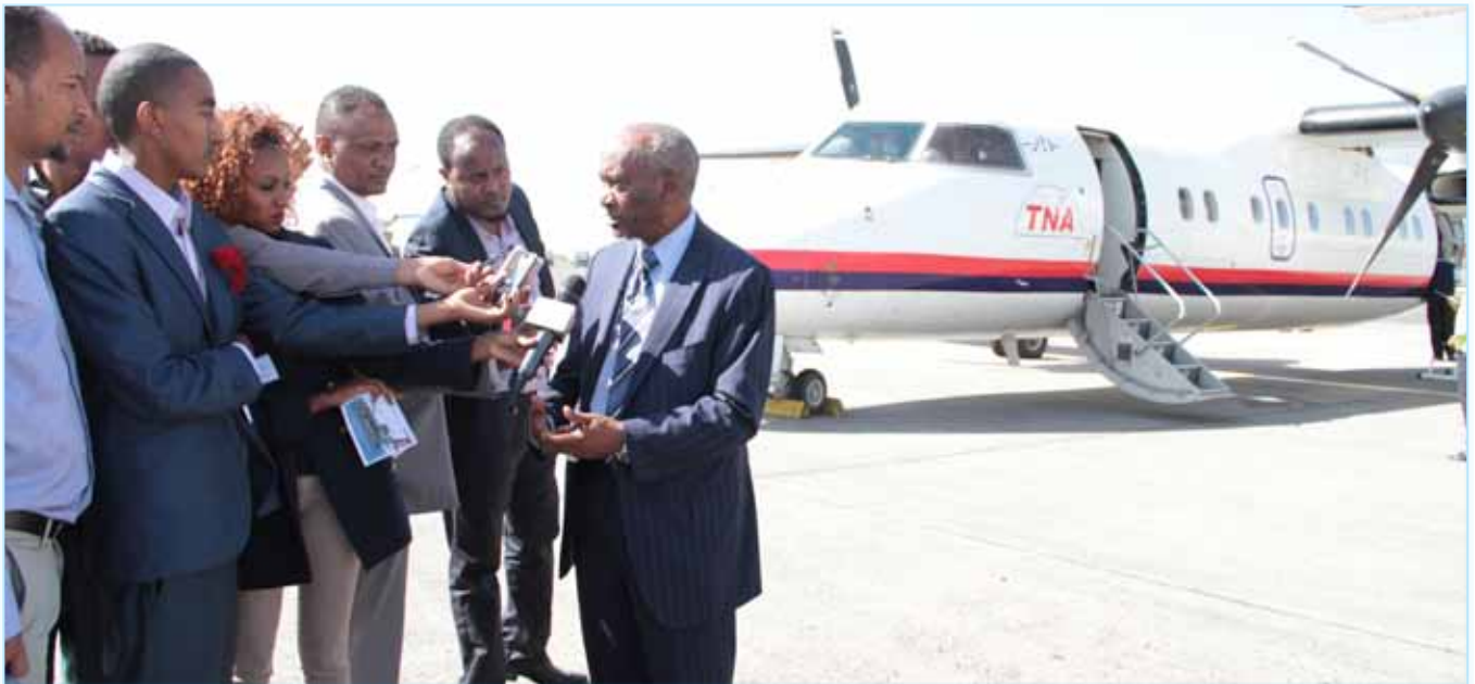
ሲ.ኤ.ኤ መደበኛ በረራውን በይፋ ሲያስጀምሩ

ትራንስ ኔሽን ኤርዌይስ ኃላዩተ.የግ.ማኅበር (ቲ.ኤን.ኤ) በአገር ውስጥ መደበኛ በረራ ላይ ለመመገብ ከኢትዮጵያ ሲ.ቪ.ል አቪዬሽን ባለስልጣን ባገኘው ፈቃድ መሠረት ጥቅምት 17 ቀን 2007 ዓ.ም. በይፋ መደበኛ በረራ ጀመረ።