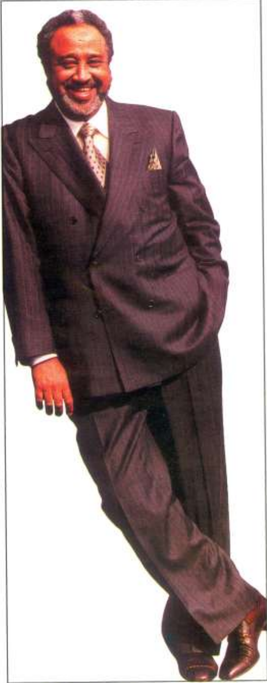
ሊቀመንበራችን ሼክ ሙሐመድ ሁሴን አል-አሙዲ Chairman, Sheik Mohammed Hussein Al-Amoudi

ለሊቀመንበራችንና ለቤተሰባቸው መልካም አዲስ ዓመት እንመኛለን። HAPPY NEW ETHIOPIAN YEAR TO OUR CHAIRMAN & HIS FAMILY